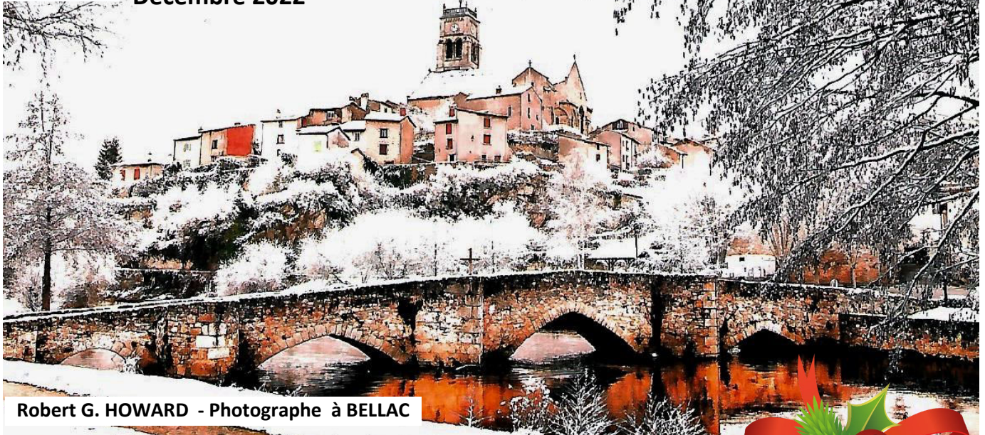
Robert G. HOWARD - Photographe à BELLAC